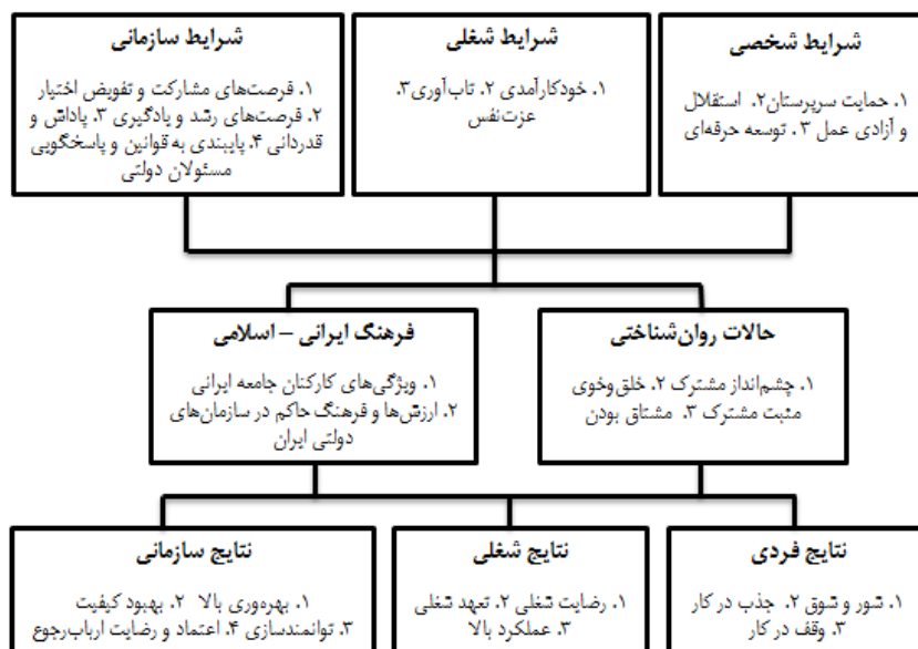
شکل ۱. الگوی مفهومی پژوهش