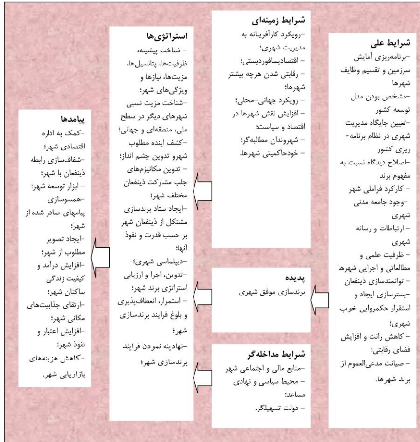
شکل ۱. مدل پارادایمی پژوهش (پژوهشگر ساخته)

کدگذاری انتخابی. آخرین مرحله کدگذاری در تئوری داده بنیاد، کدگذاری انتخابی است که روند ساخت تئوری در این مرحله شامل انتخاب مقوله اصلی به طور منظم (سیستماتیک) و ارتباط دادن آن با سایر مقوله‌ها، اعتبار بخشیدن به روابط و پر کردن جاهای خالی با مقولاتی که نیاز به اصلاح و گسترش بیشتر دارند، است (اشتراوس و کوربین، ۱۳۸۵: ۱۱۸). در این مرحله از کدگذاری برای رسیدن به یکپارچگی مورد نظر لازم است پژوهشگر خط اصلی موضوع را تنظیم و با تعهد به آن به شرح خط اصلی داستان بپردازد. الگوی نهایی حاصل از این پژوهش حاضر را می‌توان به صورت فرایند شکل ۲ نمایش داد. بر اساس فرایند پیشنهادی لازم است نخست هدف از برندسازی مورد توجه قرار گیرد. زیرا برندسازی فی‌نفسه هدف نیست و اهدافی نظیر افزایش درآمد شهر، افزایش اعتبار شهر یا بهبود تصویر شهر می‌تواند مورد استفاده قرار گیرد. به نظر می‌رسد بهترین هدفی که برندسازی می‌تواند در راستای آن استفاده