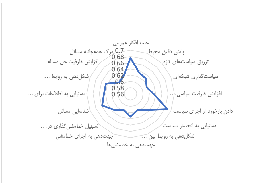
شکل ۲: اولویت‌بندی پیامدهای شبکه‌سازی سیاسی در نظام سیاست‌گذاری

در رویکرد دلفی فازی با انجام نظرسنجی از خبرگان لازم است تا اجماع نظر صورت پذیرد و این امر از قیاس نظرسنجی در طی مراحل مختلف انجام می‌گیرد. بنابراین، هنگامی که اختلاف میانگین فازی‌زدایی شده (مقدار کریسپ) در طی دو مرحله کمتر از ۰/۱ باشد؛ فرایند نظرسنجی متوقف می‌گردد، اما در صورتی که این اختلاف بیشتر از ۰/۱ باشد؛ مجدداً نظرسنجی انجام می‌گیرد و تا زمانی که اجماع نظر صورت نپذیرد، این روند ادامه می‌یابد. همان گونه که در جدول ۷ ملاحظه می‌گردد اختلاف میانگین فازی‌زدایی شده (مقدار کریسپ) در دو مرحله کمتر از ۰/۱ می‌باشد. این بدان معناست که خبرگان در خصوص پیامدهای شبکه‌سازی سیاسی به اجماع نظر رسیده‌اند و در همین مرحله نظرسنجی متوقف می‌شود. در واقع خبرگان به پیامدهای شناسایی شده در پژوهش حاضر نگاه تقریباً یکسانی دارند. با توجه به مطالب ذکر شده، در نهایت تمامی پیامدهای شبکه‌سازی سیاسی در قالب نمودار زیر نشان داده شده است.