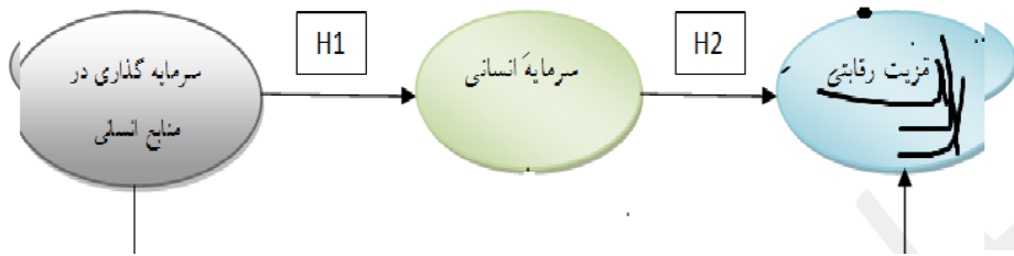
شکل نمودار ۱. مدل مفهومی تحقیق