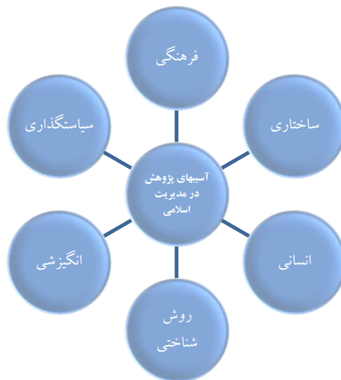
شکل ۱. ابعاد آسیب‌شناسی پژوهش در مدیریت اسلامی

بعد روش‌شناختی: این بعد مهم‌ترین آسیب‌های ناشی از ویژگی‌های روش‌شناختی و شناخت‌شناسانه پژوهش‌های انجام گرفته در حوزه مدیریت اسلامی را در بر می‌گیرد. بعد انگیزشی: آخرین بعد از مدل تحقیق هم افراد و هم سیستم‌های اجتماعی را در بر می‌گیرد و آسیب‌های ناشی از انگیزه‌های موجود برای پژوهش در حوزه مدیریت اسلامی را بررسی می‌کند.