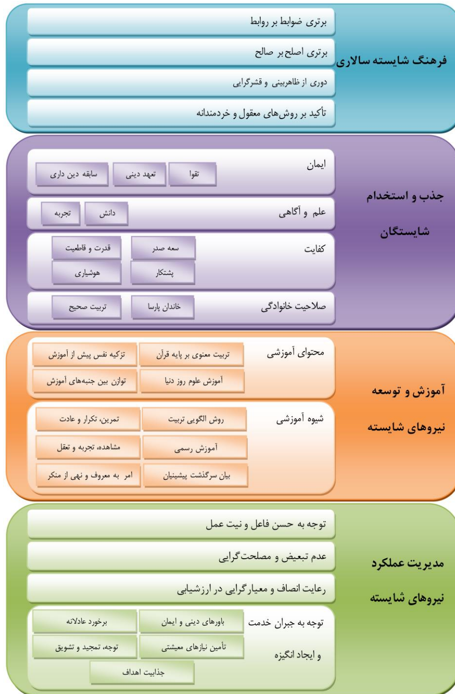
شکل ۲. شاخص‌ها و مؤلفه‌های مدل شایسته‌سالاری اسلامی