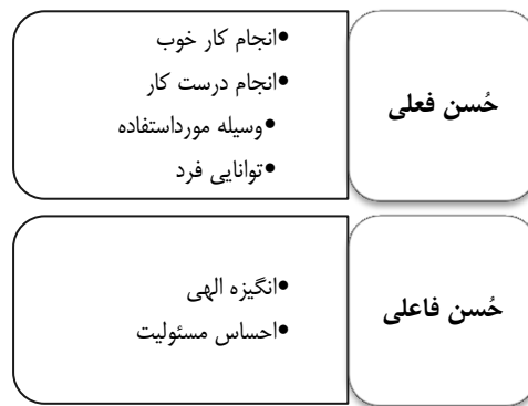
شکل ۴. مدل بسط داده شده عملکرد صالحانه