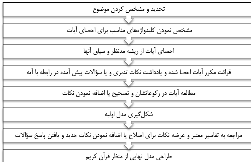
شکل ۱. فرآیند انجام پژوهش موضوعی در قرآن (جوانعلی‌آذر و مسعودی پور، ۱۳۹۱)

می‌شوند؛ درنهایت اینکه با بررسی آیات، نکات به‌دست‌آمده طبقه‌بندی و دسته‌بندی شده و با مراجعه به تفاسیر صحت برداشت‌ها سنجیده می‌شود. فرآیند روش پژوهش موضوعی در قرآن در شکل ۱، نشان داده شده است.