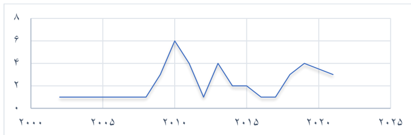
شکل ۲. توصیف مقاله‌ها بر اساس سال انتشار

شکل شماره ۲ توصیف مقاله‌ها را بر اساس سال انتشار نشان می‌دهد. بر اساس یافته‌های این پژوهش اولین مقاله مورد بررسی مربوط به سال ۲۰۰۲ و آخرین مقاله که انگیزه‌های کارآفرینی را مورد بررسی قرار داده است مربوط به سال ۲۰۲۱ می‌باشد. توزیع مقاله‌ها در مجلات مختلف نیز در جدول شماره ۷ مشاهده طبقه‌بندی شد.