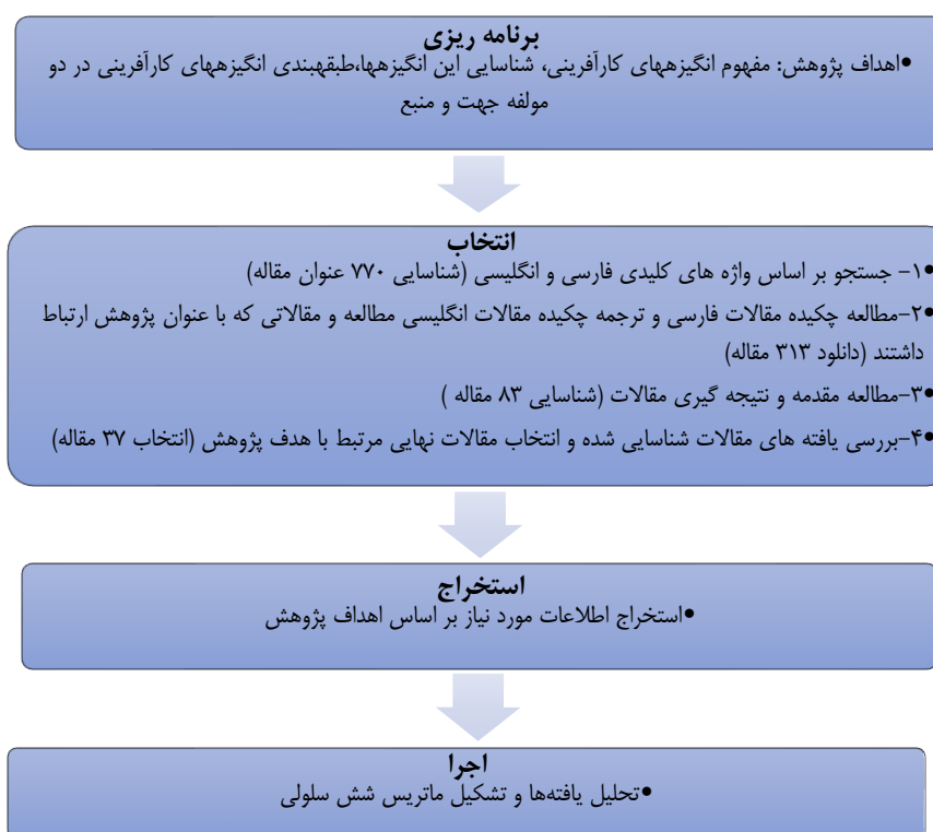
شکل ۱. فرایند انجام پژوهش

۵- یافته‌های مقالات منتخب مورد بررسی سریع قرار گرفت و ۳۷ عنوان مقاله جهت بررسی نهایی شدند. سپس به تحلیل توصیفی یا همان تحلیل کتابشناسانه ایگراشی و دیوئر ۱ (۲۰۱۳) پرداخته شد. در این پژوهش سال انتشار مقاله، نام و اعتبار مجله و نوع روش پژوهش مورد نظر قرار گرفت. در مرحله بعد یافته‌های مقاله‌ها برای پاسخگویی به پرسش‌های این پژوهش مورد مطالعه و بررسی قرار گرفت. این مرحله تحت عنوان تحلیل محتوا ۲ یا تحلیل مضمون (سورینگ و مولر ۳ ، ۲۰۰۸) شناخته می‌شود. شکل شماره ۱ فرایند انجام پژوهش را نشان می‌دهد. برای سنجش پایایی ابزار گردآوری اطلاعات فهرست انگیزه‌های گردآوری شده در اختیار یکی از خبرگان حوزه کارآفرینی قرار گرفت و پس از دسته‌بندی انگیزه‌ها در ماتریس شش سلولی توسط ایشان سلول‌های ماتریس پژوهشگر با ماتریس خبره مقایسه و نتایج توسط شاخص کاپا از نرم‌افزار SPSS ارزیابی شد که در این پژوهش شاخص کاپا برابر با ۹۳ درصد بود و k > 0/6 در آن نشان‌دهنده پایایی پژوهش است.